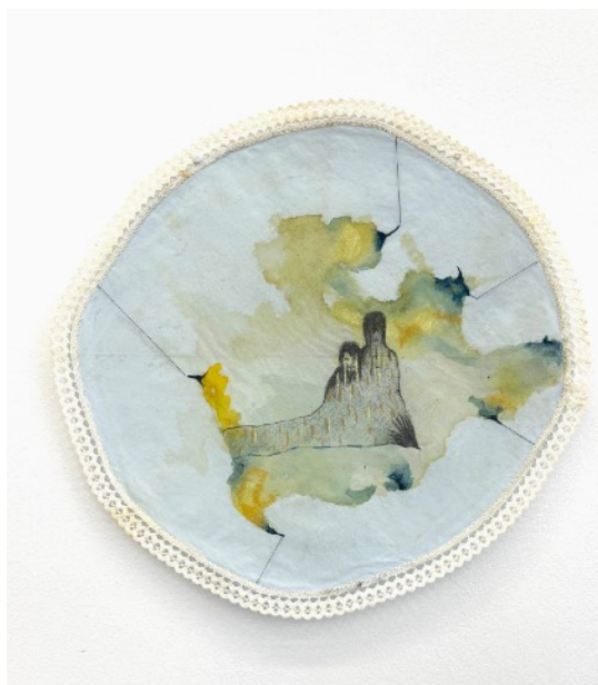
Dé-paysage , 2022 Mine graphite, crayon de couleur et couture sur tissu enchassé Prix: 700€