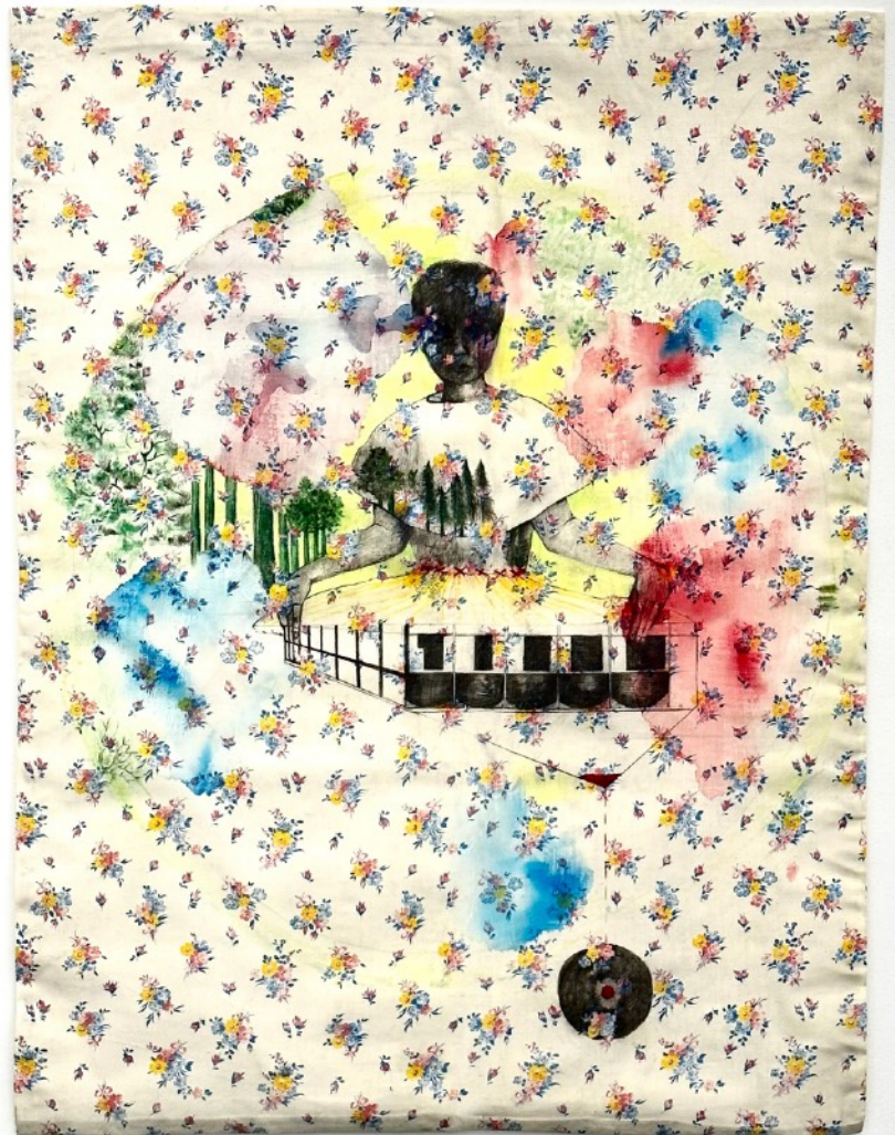
Dé-paysage , 2019 Aquarelle, mine graphite crayon de couleur sur couture sur tissus Prix: 1800€