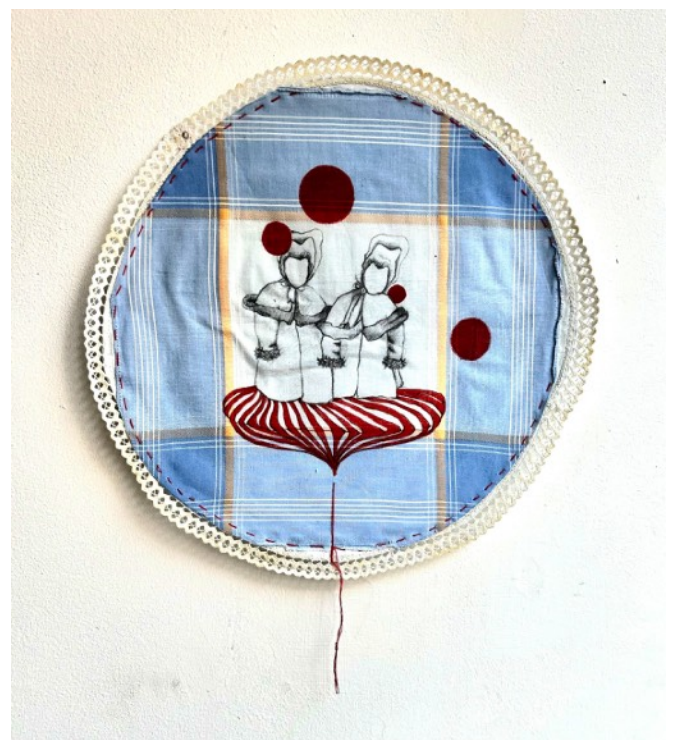
JE[UX]- tablier, 2021 Mine graphite, crayon de couleur et couture sur tissu enchassé Prix: 700€