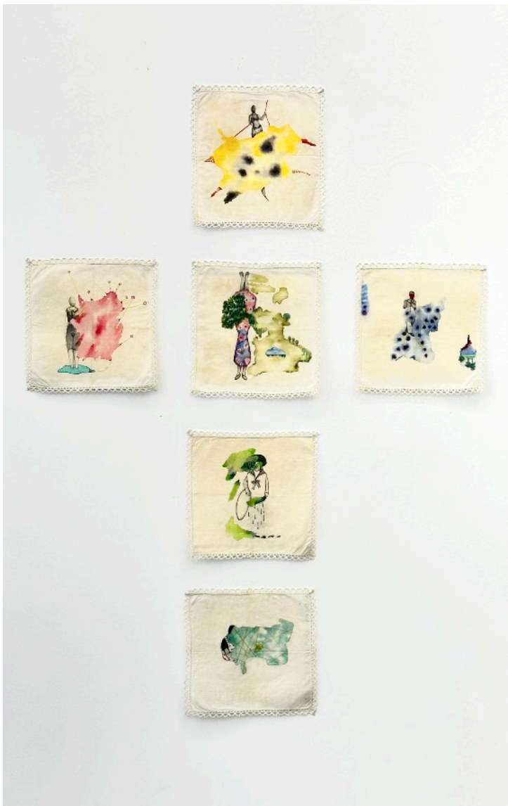
Histoire de mouchoir , 2020 Aquarelle, crayon de couleur, mine graphite et couture sur tissu. Prix: 650€