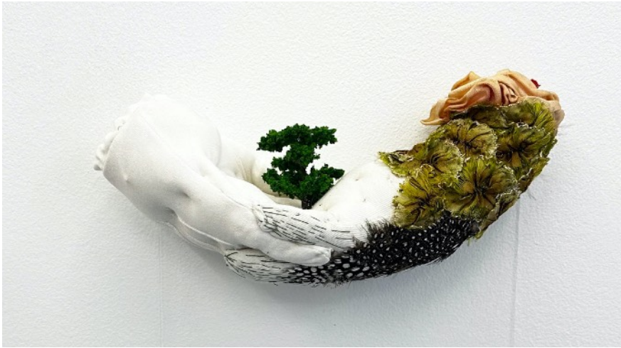
Histoire de gants, 2022 Assemblage textile Prix: 1000€