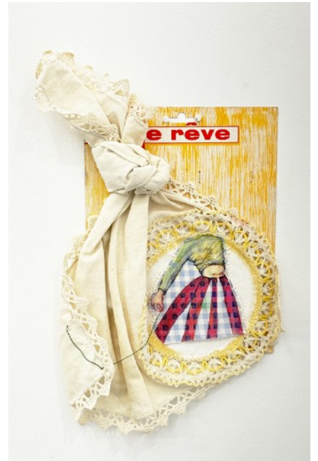
JE[UX]- Rêve , 2023 crayon de couleur sur assemblage textile Prix: 500€