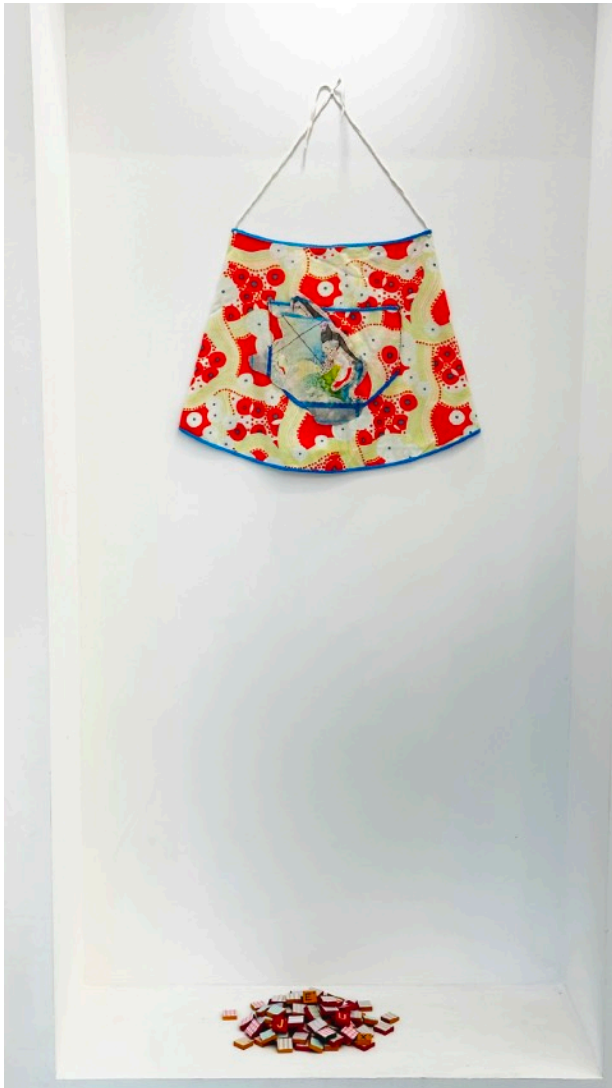
JE[UX]- tablier , 2021 aquarelle, crayon de couleur, mine graphite et couture sur tissu Prix: 1200€

jeudi 23 décembre 2021, par Elisabeth Couturier