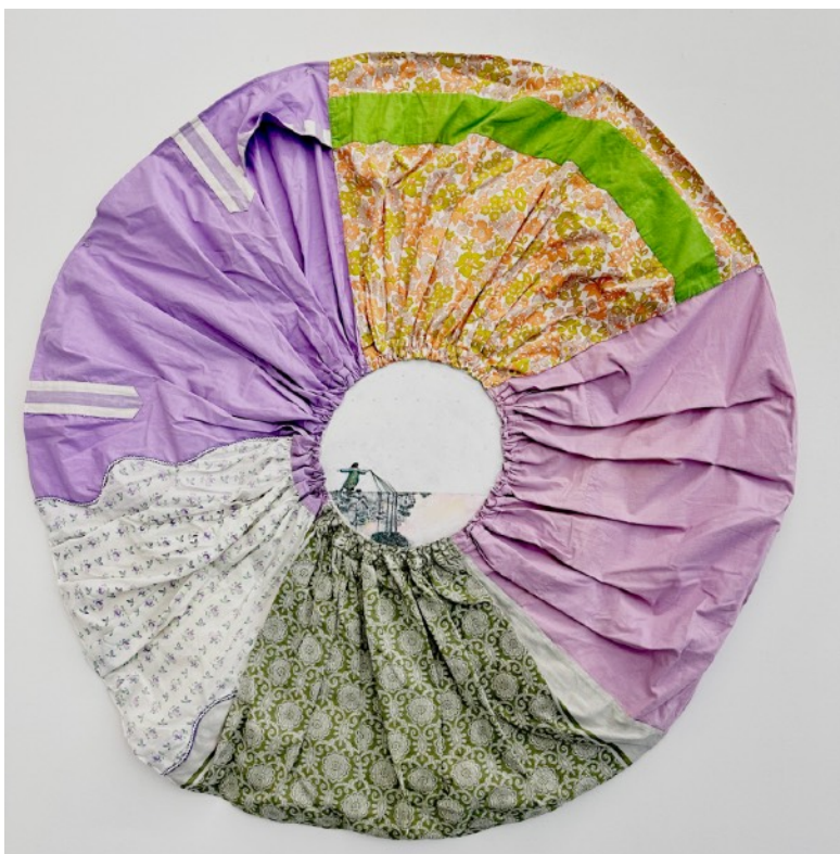
JE[UX] , Juperon , 2022 Mine graphite et couture sur assemblage tissu Prix: 2000€