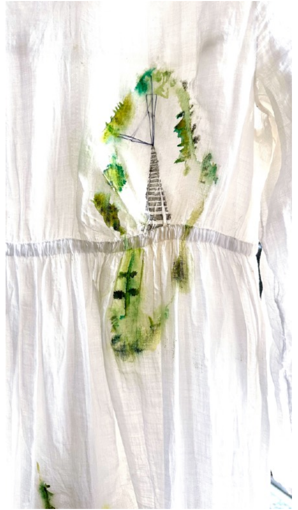
Environ, Robe de communion, 2022 mine graphite, aquarelle et couture sur tissu Prix: 3 000€