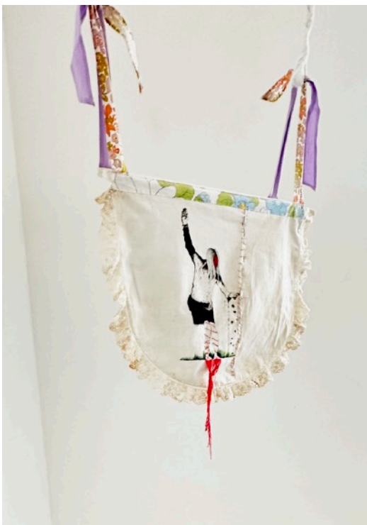
JE[UX]- Balançoire tablier, 2022 Feutre, crayon de couleur et couture sur tissu Prix: 1000€