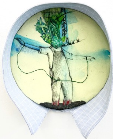
Dé-paysage , 2019 Mine graphite, crayon de couleur et couture sur tissu enchassé Prix: 600€